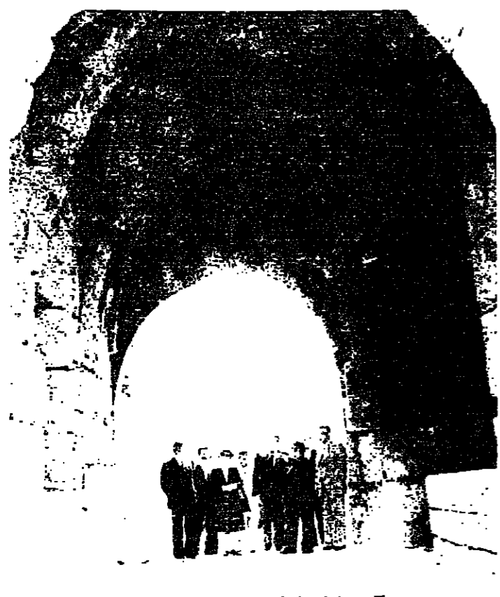
الحافظ والسفر في قلعة صيدا